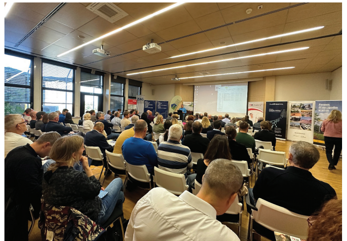
Slika 3. Na konferenci so gostili več kot 100 udeležencev.

Pri prizadevanjih za zmanjšanje porabe energije imajo pomembno vlogo tudi trajnostni materiali in elementi, kot so energetske učinkovite okna, ki so pogosto spregledani deli objektov. Podobno bi se morali v naši trajnostni prihodnosti bolj zavedati pomena aktivnih stavbnih sistemov, na primer toplotnih črpalk, ter njihovega potenciala za prenovo naših vzorcev porabe energije.